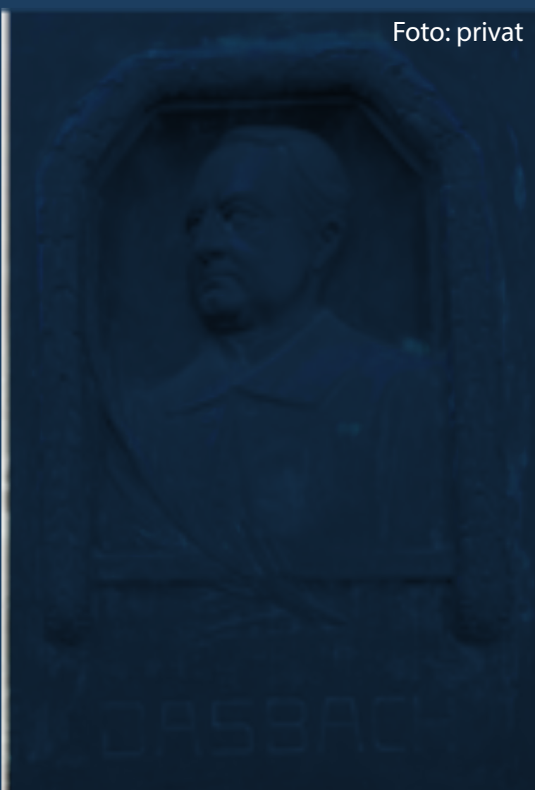
Gedenktafel für Dasbach in der Glockenstraße Trier

In der zweiten Hälfte des 19. Jahrhunderts führte die aufkommende Eisenbahn und damit verbunden eine Europäisierung des Handels dazu, dass Fleisch aus Ungarn oder Frankreich billiger zu bekommen war als Fleisch von Bauern aus Eifel und Hunsrück. Anstatt sich für eine Modernisierung der rückständigen Landwirtschaft einzusetzen, hetzte der Trierer Landvolk-Führer Georg Friedrich Dasbach gegen die jüdischen Viehhändler.